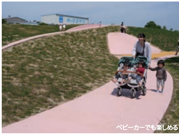
ベビーカーでも楽しめる