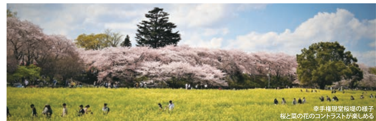
幸手権現堂桜堤の様子 桜と菜の花のコントラストが楽しめる