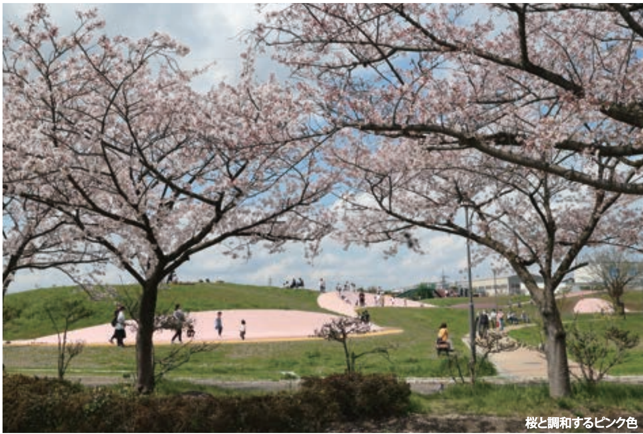
桜と調和するピンク色