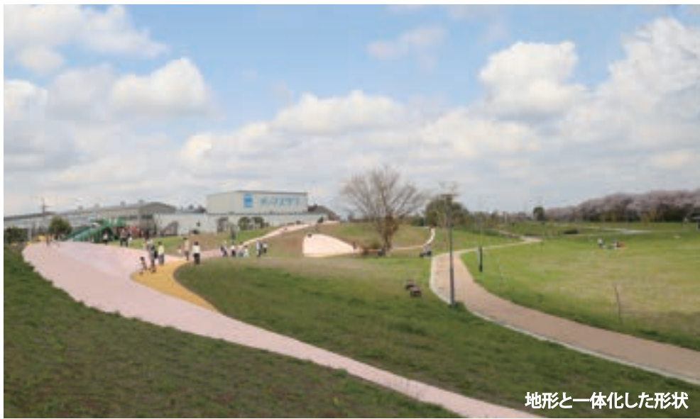
地形と一体化した形状